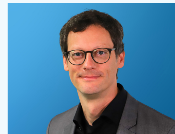
Timm Helten-Hildwein © unternehmer nrw

Nach dem Corso ging es 2005 und 2006 mit der Förderung durch das Bundesministerium für Bildung und Forschung weiter. Vor allem Kooperationspartner in Regionen wie dem Süden oder Osten Deutschlands, in denen es wenige Grundbildungsangebote gab, sollten besucht werden, um die Öffentlichkeit zu sensibilisieren